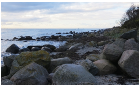
Høfder syd for Spodsbjerg.