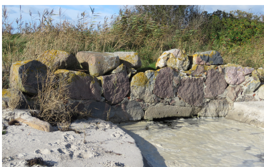
Vi går på stranden det meste af turen og passerer bl.a. Fladmose-Hellevad afløbet.