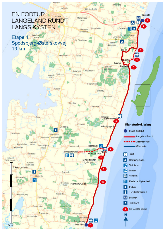
Etape 1: Vi mødes for enden af Østerskovvej, 5932 Humble, lørdag den 26. november kl. 9.

Du kan læse mere om fodturen og downloade kort og beskrivelser gratis på VisitLangelands hjemmeside https://www.langeland.dk/langeland/oplevelser/vandre-og-gaature/gaa-langeland-rundt